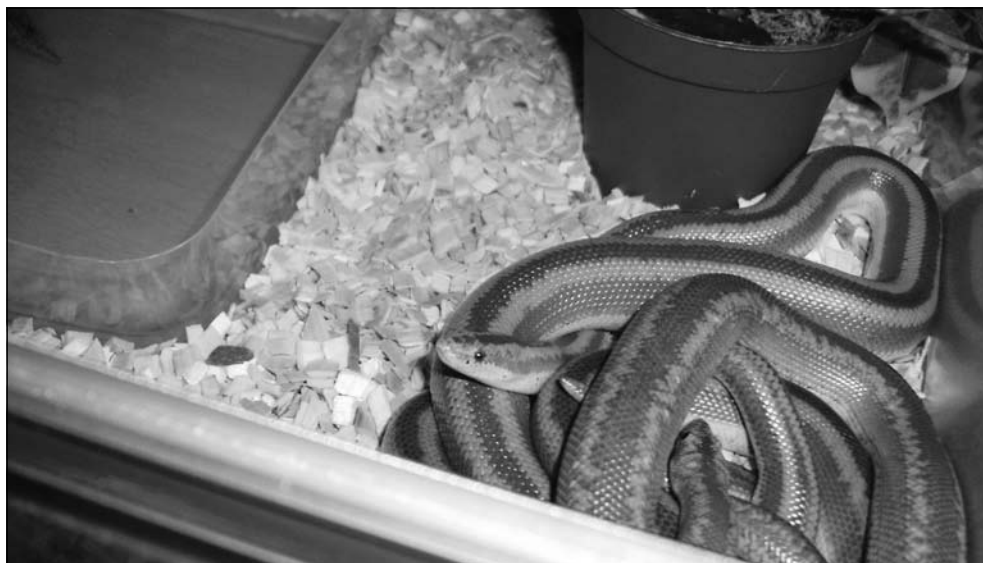
Lichanura trivirgata saslowi en Lichanura trivirgata gracia. Lichanura trivirgata saslowi en Lichanura trivirgata gracia.