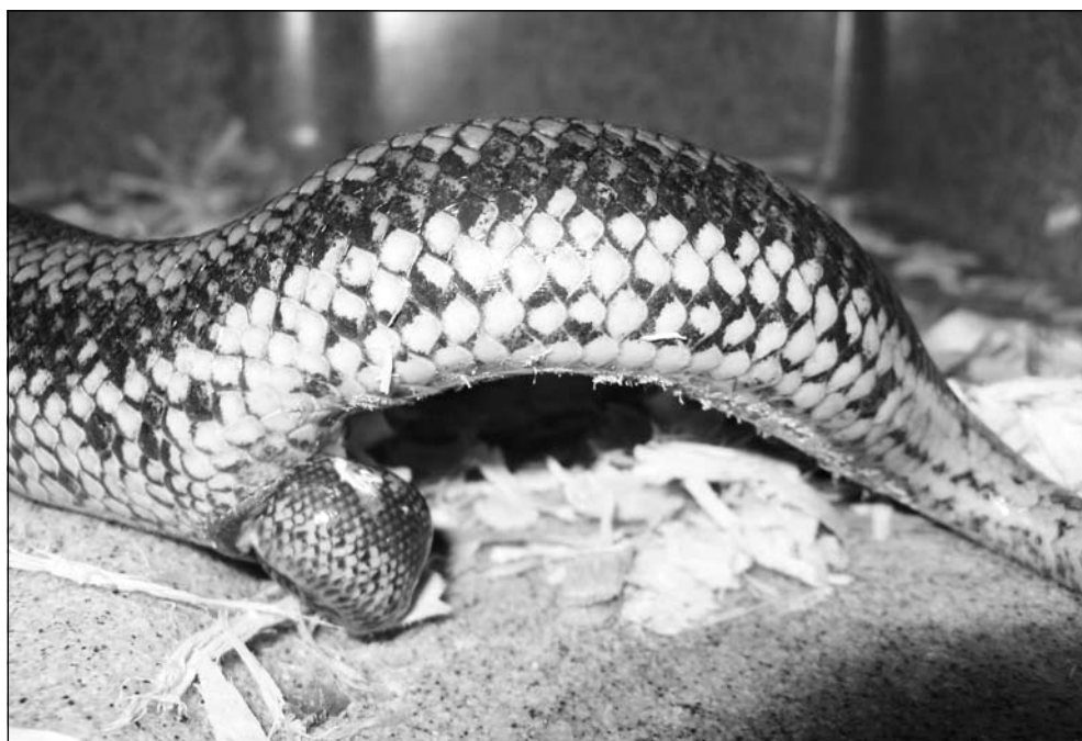
Geboorteserie van Lichanura trivirgata . Photo: Ryan Shatto. Birth serial of Lichanura trivirgata . Photo: Ryan Shatto.

Generally the Rosy Boa is divided into three recognized subspecies as follows: Mexican Rosy Boa (COPE 1861), Lichanura trivirgata trivirgata , Desert Rosy Boa Lichanura trivirgata gracia (KLAUBER 1931), and Coastal Rosy Boa Lichanura trivirgata roseofusca (COPE 1868). Although not a valid subspecies, a fourth subspecies is often used especially among herpetoculturalists, the Mid-Baja Rosy Boa Lichanura trivirgata saslowi .