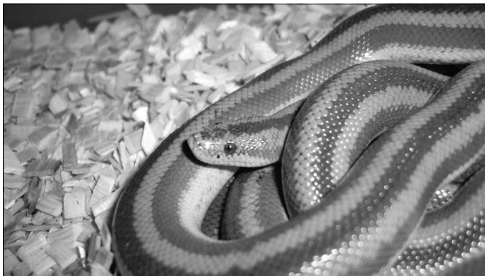
Lichanura trivirgata saslowi. Lichanura trivirgata saslowi.