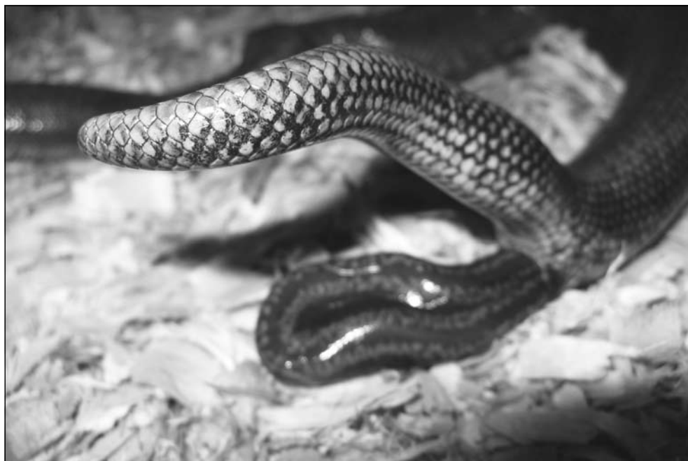
Geboorteserie van Lichanura trivirgata . Photo: Ryan Shatto. Birth serial of Lichanura trivirgata . Photo: Ryan Shatto.

temperatures. The warm area should heat up to about 29 to 32 degrees Celsius and the ambient temperatures can vary between 22 and 26 degrees. The heater can be turned off at night. Easiest way to accomplish this is to use a timer. Any non dusty, absorbent material like newspaper and wood or bark chips can be used as ground material. To allow the snake to burrow one can add a thick layer of ground material. Hiding places like caves, bark and rocks are also important. If you use heavy rocks in your enclosure, make sure they cannot collapse on your animal. There should be places to hide in both sides of the terrarium to allow the snake to feel secure in any temperature. One can utilize the height of the terrarium