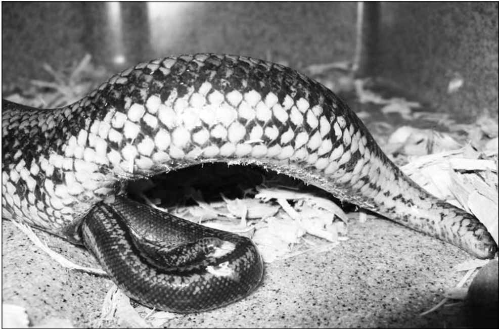
Geboorteserie van Lichanura trivirgata . Photo: Ryan Shatto. Birth serial of Lichanura trivirgata . Photo: Ryan Shatto.

A thermal gradient is vital for all cold blooded animals. The Rosy Boa should also have access to a gradient in temperatures. Usually an under tank heater covering about 1/3 of the tanks floor space is an excellent way to arrange proper