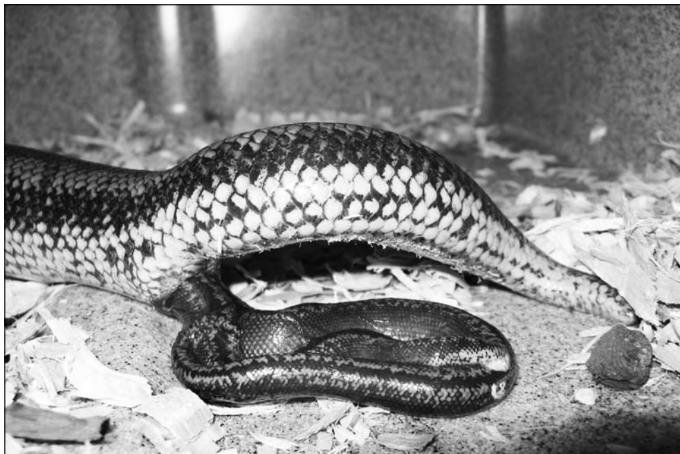
Geboorteserie van Lichanura trivirgata . Photo: Ryan Shatto. Birth serial of Lichanura trivirgata . Photo: Ryan Shatto.

The most common hardship Rosy Boas might encounter is stress. Sudden environmental changes, wrong temperatures or over handling might cause stress. A common