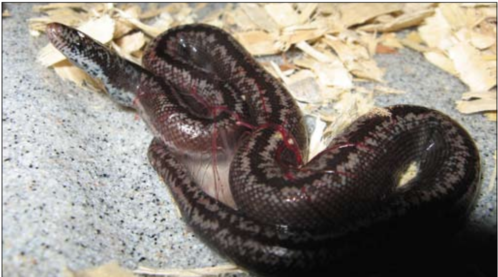
Geboortserie van Lichanura trivirgata . Photo: Ryan Shatto. Birth serial of Lichanura trivirgata . Photo: Ryan Shatto.