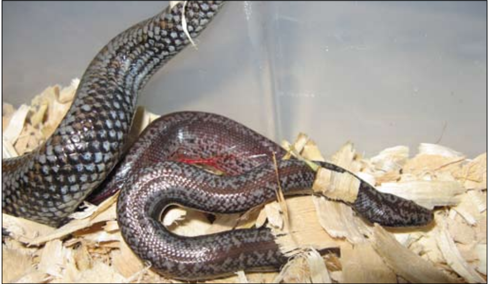
Geboortserie van Lichanura trivirgata . Photo: Ryan Shatto. Birth serial of Lichanura trivirgata . Photo: Ryan Shatto.