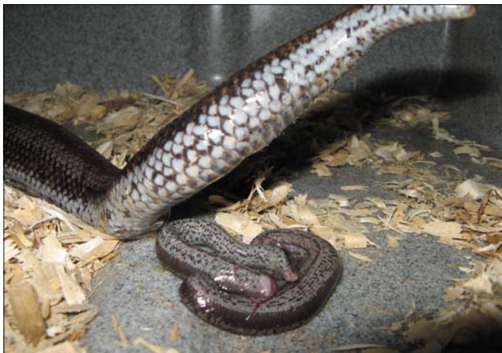
Geboorteserie van Lichanura trivirgata . Photo: Ryan Shatto. Birth serial of Lichanura trivirgata . Photo: Ryan Shatto.

It would be good to offer plenty of food to the female before and after the cooling period to enable her to be in optimal condition to develop embryos into healthy babies.