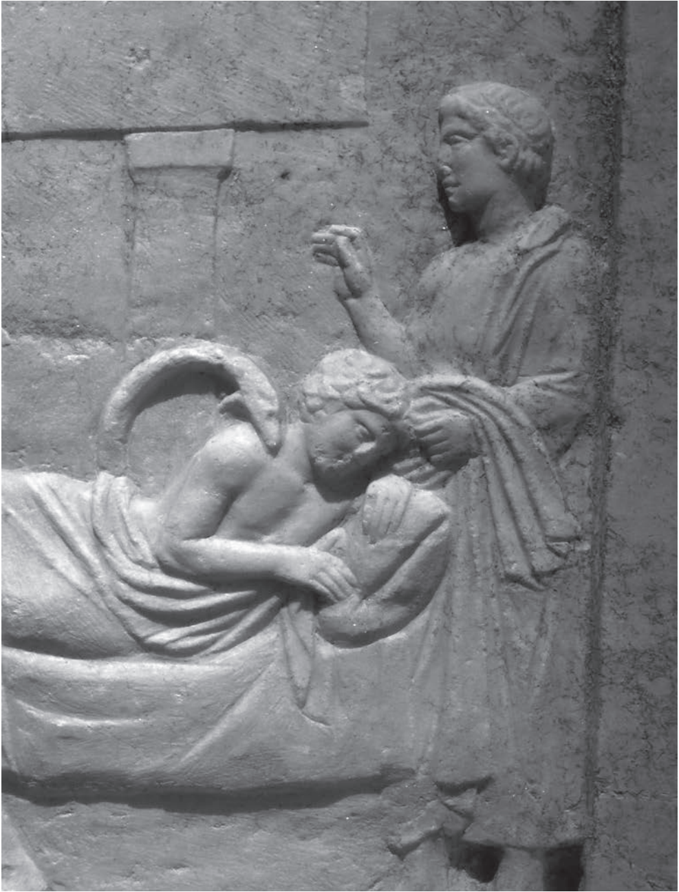
Foto 1: Deel van een ex voto in marmer. Een patiënt wordt behandeld. / Part of a votive relief in marber. A patient being cured. Nationaal Archeologisch Museum, Athene.