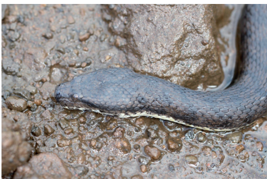
Fig. 5 Cerberus schneideri from the Moluccan island Ternate, adult specimen.