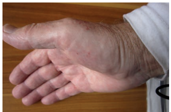
Fig. 6 Cerberus schneideri bite wounds.