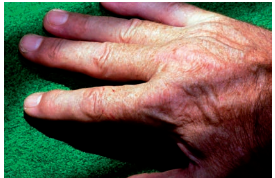
Fig. 4 Enhydris plumbea bite wounds 1 hr 30 min after the bite.