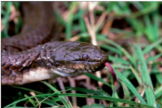
Fig. 3 Enhydris plumbea from Sulawesi, adult specimen, length about 35 cm.