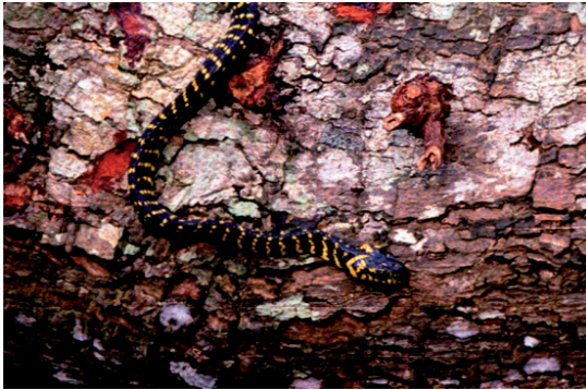
Fig. 1 Boiga dendrophila gemmicincta from Sulawesi, subadult of about 80 cm.